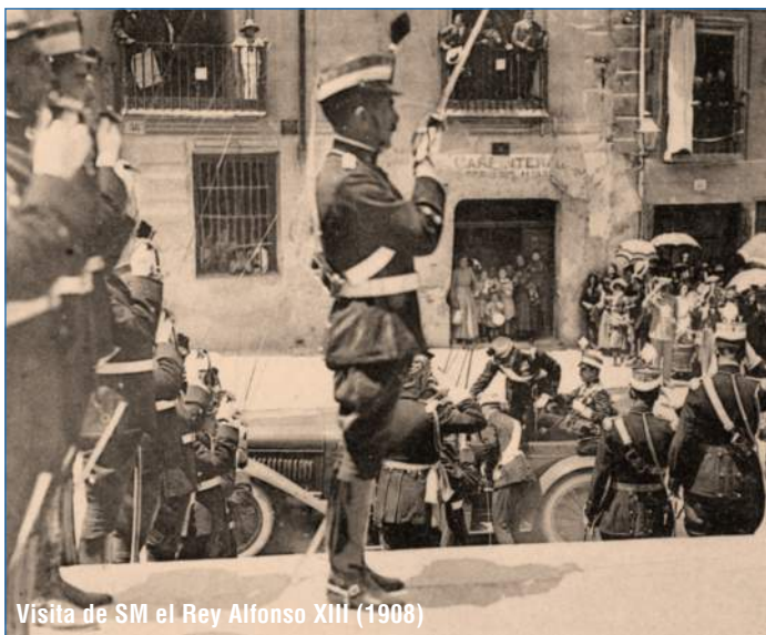
Visita de SM el Rey Alfonso XIII (1908)

La exposición no está organizada cronológicamente sino que en ocasiones el protagonista es un acontecimiento solemne, como sin lugar a dudas fueron las visitas de las primeras autoridades del Estado. Lo mismo ocurre con las juras de bandera o el acompañamiento de las procesiones con ocasión de las fiestas de Corpus Christie, Semana Santa o el traslado de la Virgen de la Fuencisla desde el santuario a la Catedral.