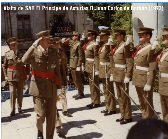
Visita de SAR El Príncipe de Asturias D. Juan Carlos de Borbón (1973)

La exposición no está organizada cronológicamente sino que en ocasiones el protagonista es un acontecimiento solemne, como sin lugar a dudas fueron las visitas de las primeras autoridades del Estado. Lo mismo ocurre con las juras de bandera o el acompañamiento de las procesiones con ocasión de las fiestas de Corpus Christie, Semana Santa o el traslado de la Virgen de la Fuencisla desde el santuario a la Catedral.