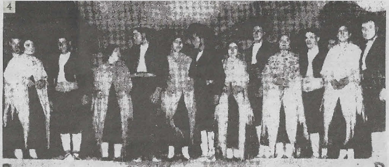
1 y 2 - Fotos cedidas por el Museo Rodera-Robles de su exposición temporal '20 años del siglo XX' 3 - Anuncio publicado en 'El Adelantado de Segovia' en 1929 4 - Imagen incluida como documentación histórica en el proyecto de rehabilitación, publicada por ABC en 1933 y correspondiente a la representación de una zarzuela de costumbres segovianas, 'La del soto del Parral'.