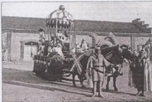
Homenaje a Segovia. Desfile de carrozas alegóricas. 1915.