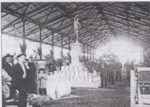
Exposición Provincial. 1901.

Segovia es una pequeña ciudad, con calles estrechas y caserío envejecido. Contaba con luz eléctrica y desde hacía pocos años con el ferrocarril. Su población era de 14.500 habitantes en 1900 y 18.000 en 1930. Junto con el