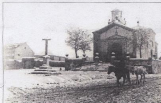
Ermida del Cristo del Mercado. 1933.

Ordizola sentó las bases, con sus proyectos de alineación, de la ciudad que hoy habitamos. Arquitecto de su tiempo, introdujo el empleo del hierro -el viaducto para el tranvía que acercaría el ferrocarril a la ciudad alta es un paradigma- sin embargo, hubo de reconocer que intervenir en ésta era imposible. Su carga monumental y su trazado se imponían a la "modernidad". En 1884 fue declarado Monumento Nacional el Acueducto -no sin gran polémica-. Le seguirían la torre de San Esteban (1894), El Parral (1914) y la Vera Cruz (1919), lo que no evitaría que en 1915 se demoliera el convento