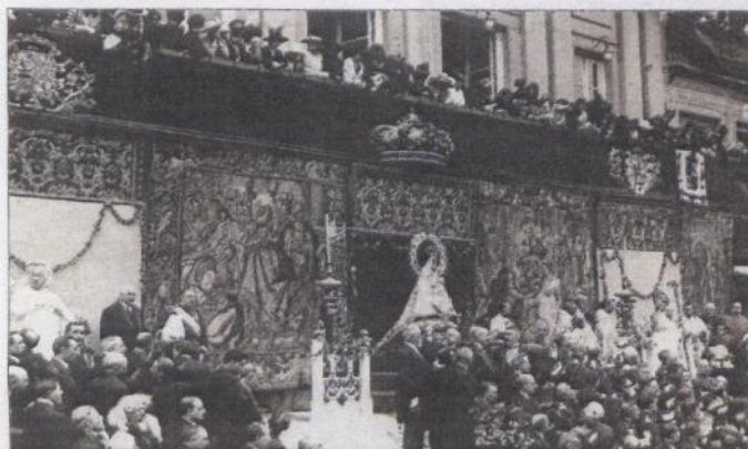
Coronación Canónica de la Virgen de la Fuencisla. 1916.