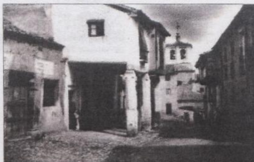
Calle de la Plata. 1933.

Segovia siempre había sido, para el viajero ilustrado, punto obligado de visita en su gira por España. Hablamos del Acueducto, pero a él se irían sumando otros edificios y la propia ciudad. En 1905, el Ayuntamiento publica una octavilla con el fin de atender bien al turista: "La Ciudad del Acueducto y de los templos románicos es, desde hace algún tiempo, visitada por numerosos turistas españoles y extranjeros, que vienen a admirar sus artísticas riquezas y sus históricos monu-