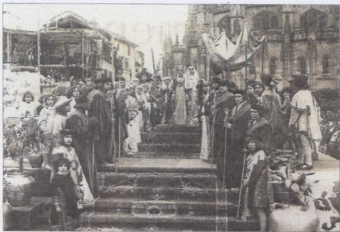
Cabalgata Histórica de la Proclamación de Isabel la Católica. 1916.