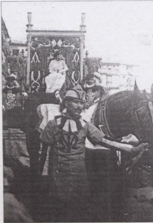
Homenaje a Segovia. Desfile de carrozas alegóricas. 1915.

Ayuntamiento otras dos entidades de peso: el Ejército y la Iglesia. Los establecimientos militares, Academia de Artillería, Parque de Artillería y Regimiento, ocupan buena parte de los arrabales del sur. La Iglesia se extiende por toda la ciudad. Las antiguas parroquias se han reducido a cuatro: Sta. Bárbara (catedral) y San Martín en el recinto amurallado, San Millán y El Salvador extramuros. Algunas congregaciones religiosas han regresado después del período desamortizador, pero de otras quedan los amplios edificios, en mejor o peor estado, que un día los albergaron.