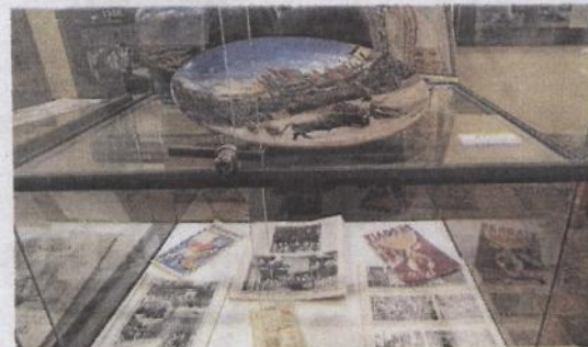
Cerámica de Zuloaga y publicaciones.