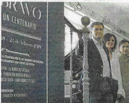
El presidente de la Diputación, junto a un cartel del centenario.

Podrá visitarse, de miércoles a domingo, hasta finales del mes de febrero