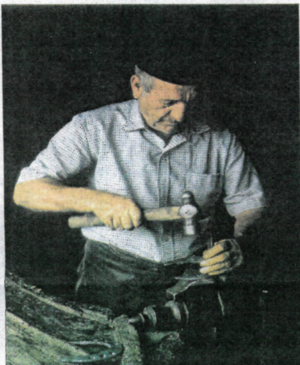
Comezterrácín. Herrero 1990. / PEDRO VELASCO

Por otro lado, colgadas en los muros de las estancias que albergan las muestras temporales, sesenta fotografías que completan los '3 Modos de Mirar'. Los autores ofrecen al visitante tres enfoques diferentes, tanto en la observación de lo fotografiado, como de las distintas técnicas de captar lo visionado: de la actualidad digital almacenada en una tarjeta SIM, al pasado analógico del carrete y la diapositiva.