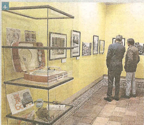
1. A la inauguración de la exposición acudió un numeroso público, que coincidió en destacar la originalidad de una exposición, llena de objetos e imágenes curiosas. 2. En la muestra se exhibe uno de los primeros aparatos de televisión, marca Askar. 3. Uno de los apartados más llamativos de la exposición se refiere a la muestra de colección de botellas de la época. 4. En primer plano, la vitrina dedicada al 'Seiscientos', donde puede verse un tocadiscos original./ JUAN MARTÍN