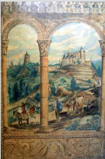
37. Alegoría Segoviana (Acuarela). Pintado a los 15 años