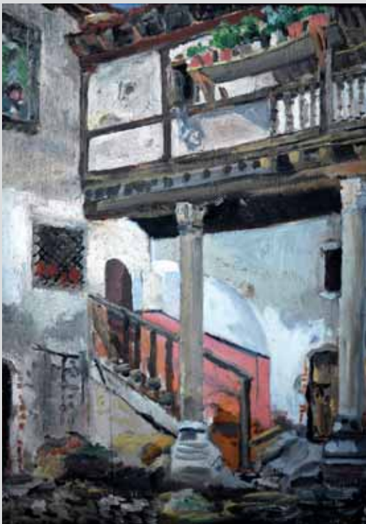
34. Patio de Escuderos (Óleo)