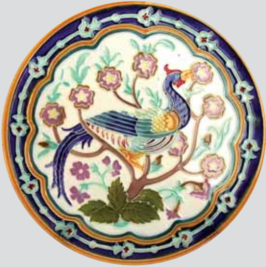
1. Plato. Serie orientalizante. Taller de D. Daniel Zuloaga.