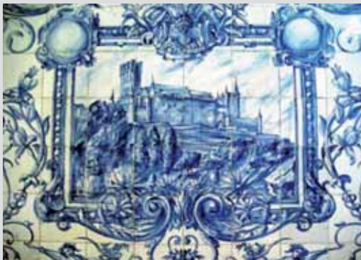
20. Alcázar de Segovia en la Fuencisla