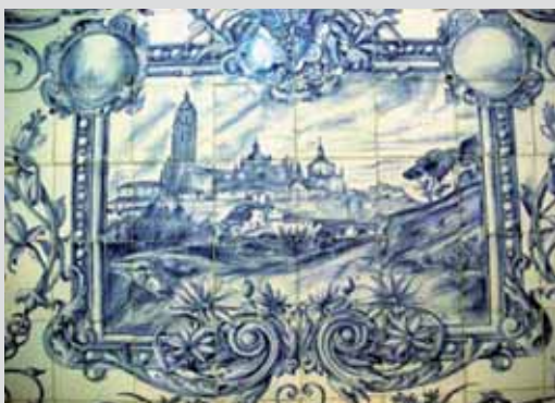
21. La Catedral de Segovia en la Fuencisla