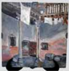
18. Azulejo con el patio de la Casa de Escuderos, 13 donde vivió Gregorio Arnanz