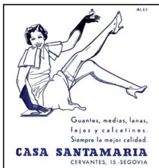
Los anuncios de Casa Santamaría fueron muy famosos en la Segovia de los años 30. Este dibujo está en el programa de ferias de 1935.

Yo les aconsejo que no dejen de visitar esta exposición.