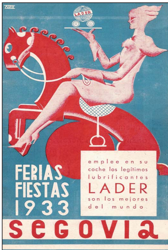
Ilustración de cubierta del programa de festejos de 1933, con publicidad incluida.