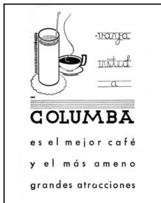
Publicidad del Columba, el café-bar del Azoguejo. Año 1933.