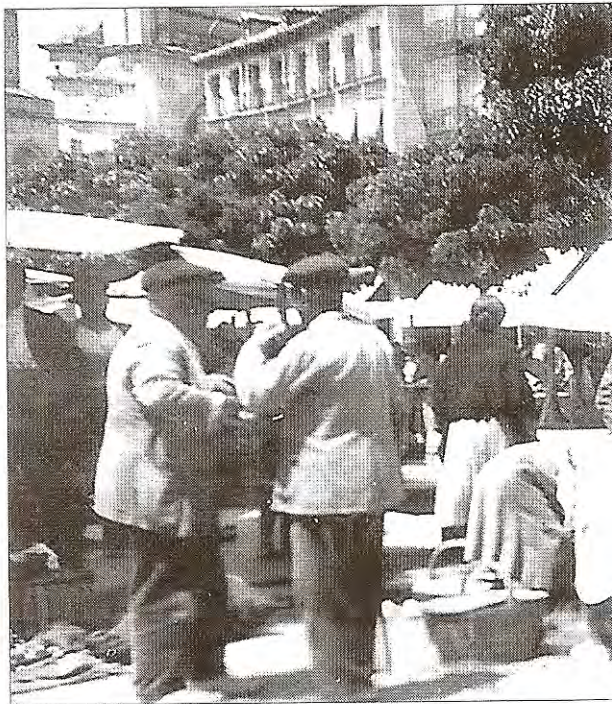
Escena de un mercado en la Plaza Mayor de Segovia a inicios del siglo XX en la que se pueden