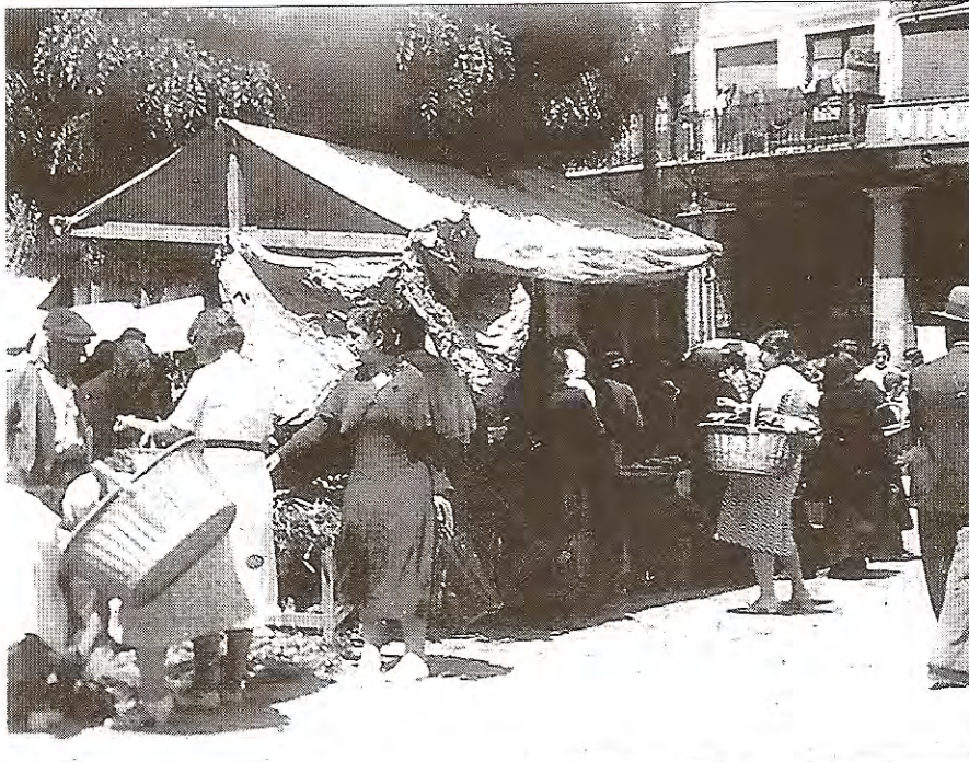
preciar la evolución en la indumentaria de los segovianos y de los puestos de venta.