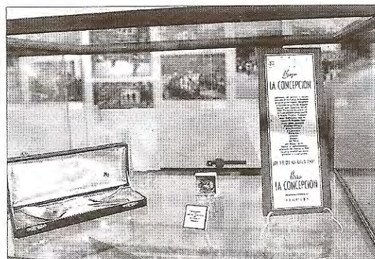
Objetos expuestos del bazar La Concepción.

La exposición estará abierta hasta el mes de junio de 2012 (de 10.30 a 2 y de 5 a 7, salvo los lunes y domingos tarde, que permanece cerrada). En las Navidades se contará además con un horario especial, de 7 a 9, durante los días 23, 25, 26, 27, 28, 29, 30 de diciembre, y 1, 3 y 4 de enero.