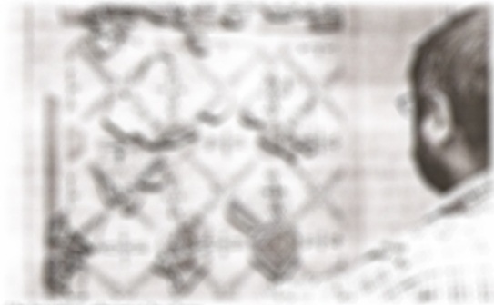
El Yacimiento de Coca en Segovia.

El Museo de Historia de Segovia ha presentado la pintura mural del Yacimiento de Coca, pieza del mes en el Museo. Se trata de una obra de arte que forma parte de un conjunto de pinturas murales descubiertas en el yacimiento de Coca, en el municipio de Coca (Segovia). La obra muestra una escena con varias figuras y elementos decorativos. El museo ha organizado una exposición para mostrar esta obra y otros hallazgos arqueológicos.