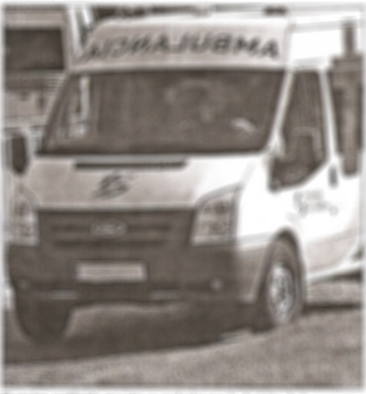
El equipo sustituido tras haberse producido un accidente que le afectó a la empresa.