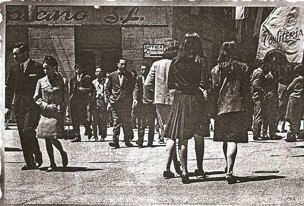
Trasiego en la plazuela del Corpus, con Casa Ulpiano al fondo.