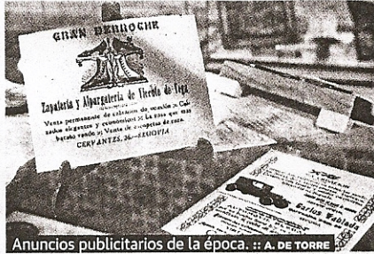
Anuncios publicitarios de la época.