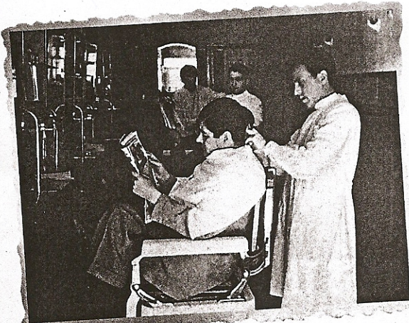
Barbería de la calle Cervantes, un día de diario.

Las 'sirenas' de San Martín también han sido testigo de los cambios en la vida comercial. Muebles Román López, Almacenes Heredero, el Gran Hotel Las Sirenas, la zapatería Los Chicos... (A comienzos del siglo XX funcionaban en esta zona la zapatería La Garza Real y la Imprenta de Ondero, en la mismísima Casa del Siglo XV). Y los establecimientos siguen pasando, como si de una película cinematográfica-