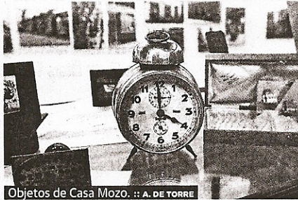
Objetos de Casa Mozo.