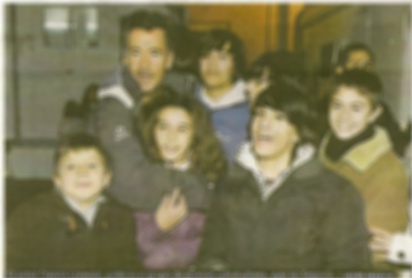
El Núcleo acoge el estreno de la serie 'Agulónje'

La muestra permanecerá abierta hasta junio, aunque en Navidad tendrá un horario especial. Los días 23, 25, 26, 28, 29 y 30 de este mes, así como el 1, 2, 3 y 4 de enero podrá visitarse de 19.00 a 21.00 horas.